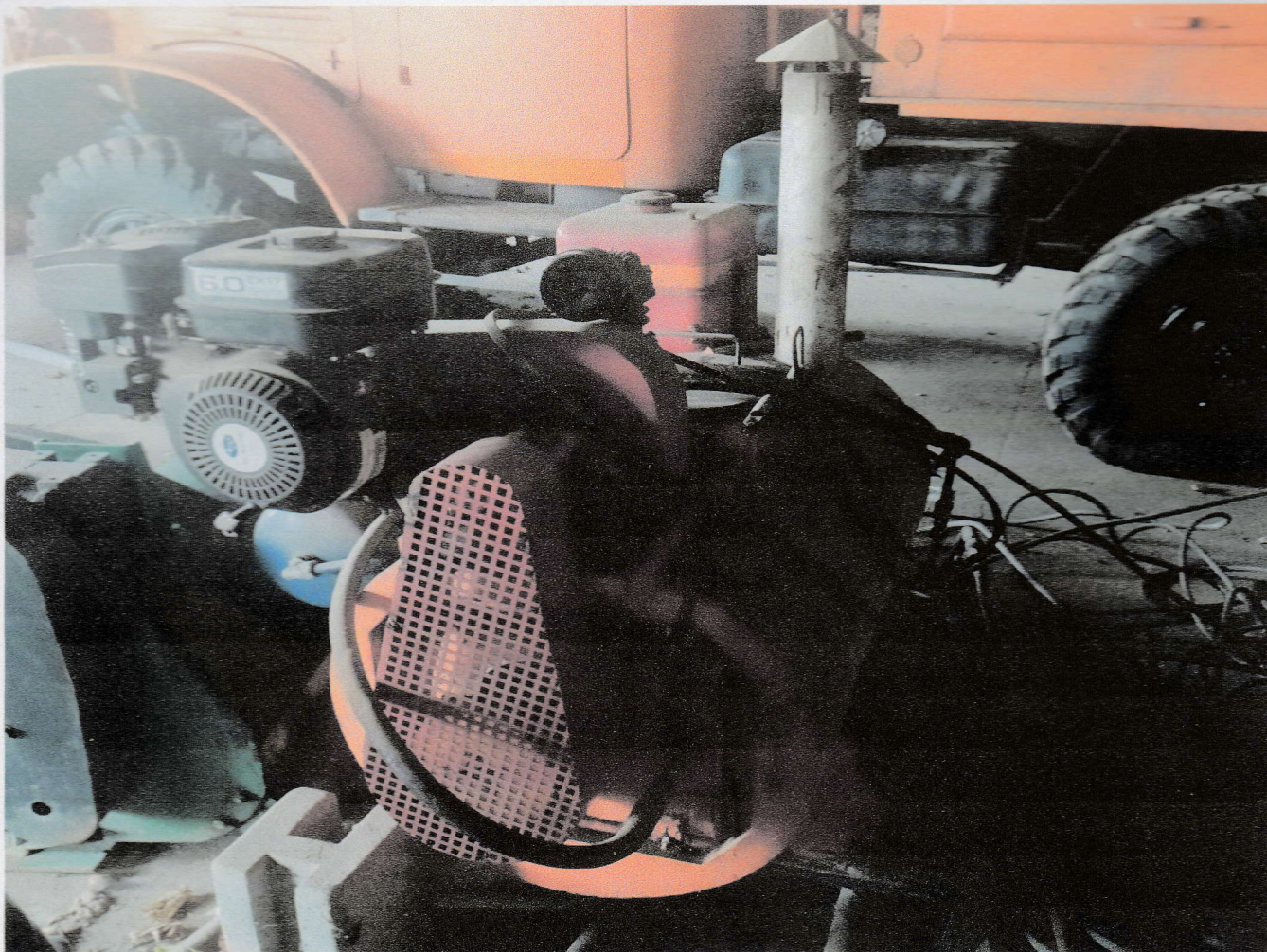
Fot. Nr 1 Widok prawej strony skraparki++.